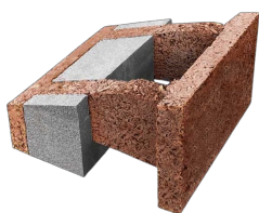
Bloc pour pente