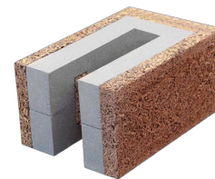
Bloc de bordure