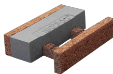
Bloc de réhausse