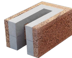
Bloc de bordure