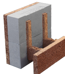
Bloc de rive