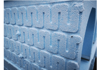
Schéma des rails