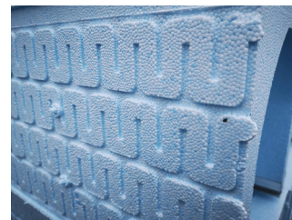
Schéma des rails